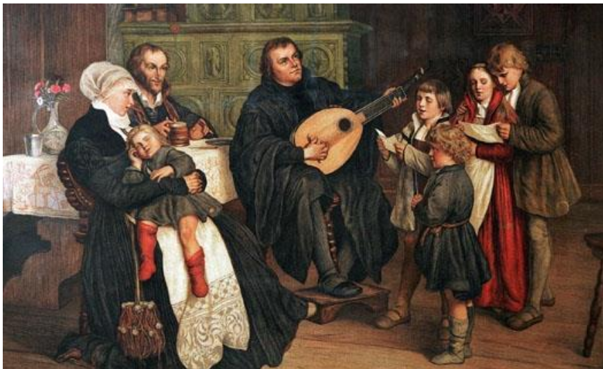
Густав Спангенберг. «Лютер, занимающийся музыкой в своем семейном кругу» (1865; картина находится в лейпцигском музее).

«... Я вас избрал...» Евангелие от Иоанна 15:16