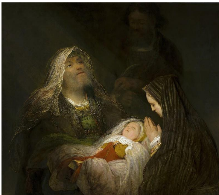
Арент де Гелдер. «Хвалебная песнь Симеона»

Христианская община, подобно Симеону, принимает Младенца Христа, как свое спасение, и возносит Господу Хвалу. Каждый христианин празднует рождение своего спасения в эти рождественские дни. Всякий раз рождество дарит нам эту чудесную встречу с Самим Богом.